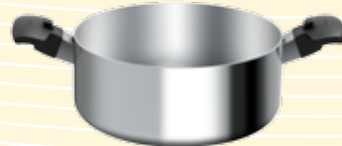
Olla de 6 cuartos