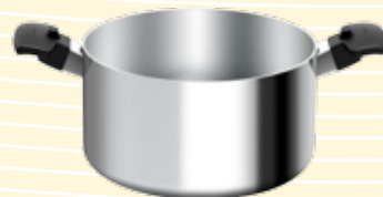
Olla de 8 cuartos