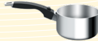
Olla de 2 cuartos