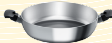
Paellera de 14 pulgadas