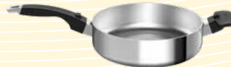
Sartén de 10½ pulgadas